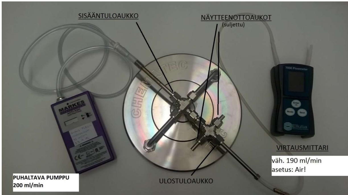
Kuva 1. Kuvun huuhtelu (vaihe 1) ja tuuletus (vaihe 2)