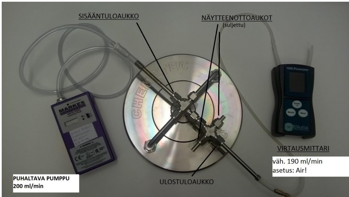
Kuva 1 Kuvun huuhtelu (1) ja tuuletus (2)